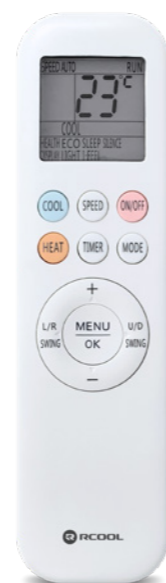
Letisztult távirányító háttérvilágítással