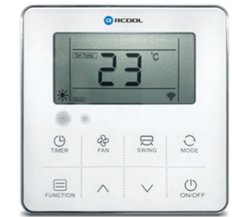
Erintésérzékeny vezetékes távirányító (alap tartozék)