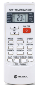
Könnyen kezelhető távirányító