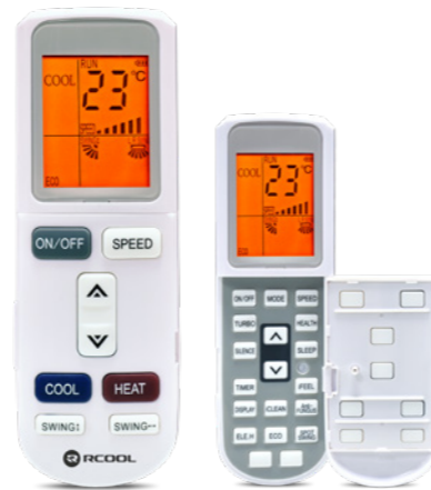
Nyitható távirányító háttérvilágítással