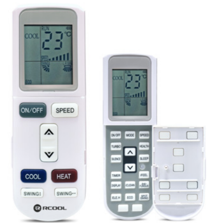
Nyitható távirányító extra funkciókkal