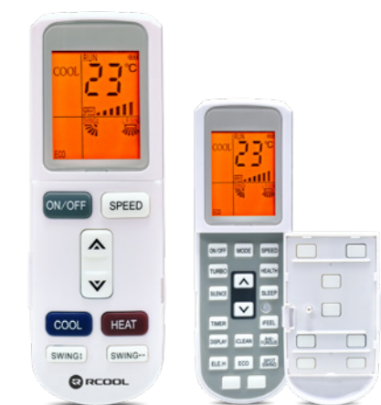
Nyitható távirányító háttérvilágítással