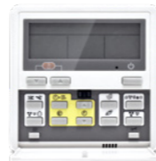
Vezetékes távirányító (opcionális)