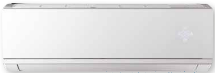
FISHER COMFORT PLUS